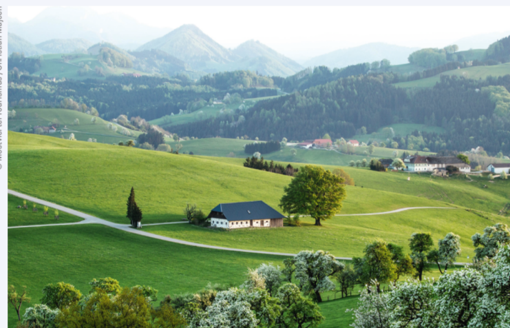
DAS MOSTVIERTEL SPIELT LANDSCHAFTLICH ALLE STÜCKE.

Mehr zum Thema: → www.niederosterreich.at/mostviertel