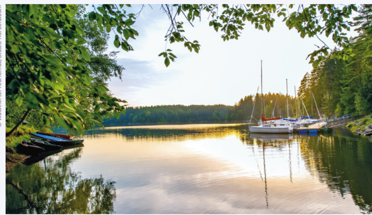
DER STAUSEE OTTENSTEIN IST EIN FREIZEITPARADIES.

Mehr zum Thema: → www.niederosterreich.at/waldviertel