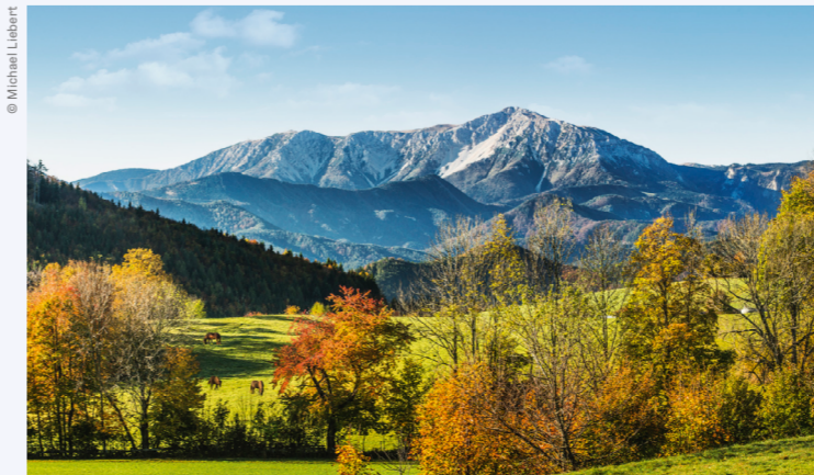
DIE WIENER ALPEN SIND IMMER EINEN AUSFLUG WERT.

Mehr zum Thema: → www.niederosterreich.at/wiener-alpen