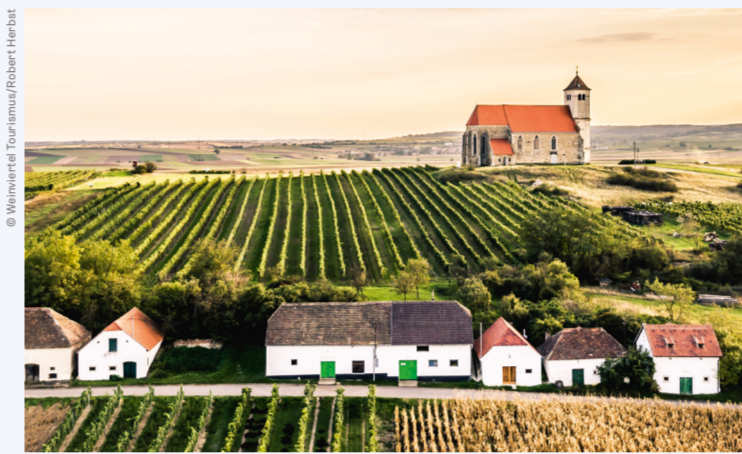
KELLERGASSEN UND PRESSHÄUSER PRÄGEN DAS WEINVIERTEL.

Mehr zum Thema: → www.niederosterreich.at/weinviertel