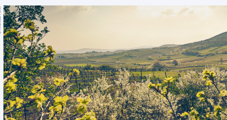
OPTISCHER GENUSS: DAS FRÜHLINGSERWACHEN IM WIENERWALD.

Mehr zum Thema: → www.niederosterreich.at/wienerwald