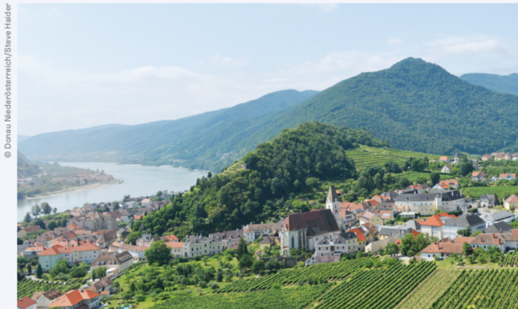
DIE DONAU IST DIE LEBENSADER NIEDERÖSTERREICHS.

Mehr zum Thema: → www.niederosterreich.at/donau